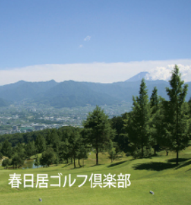
春日居ゴルフ倶楽部