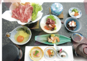
和風御膳レギュラー