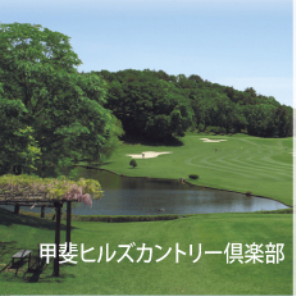
甲斐ヒルズカントリー倶楽部