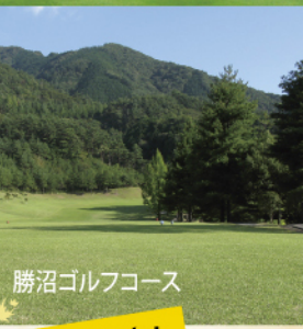
勝沼ゴルフコース