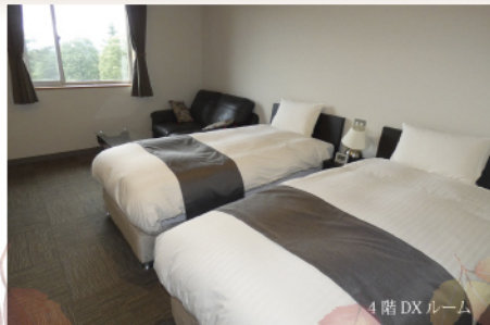
4階 DX ルーム