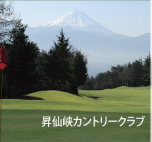
昇仙峡カントリークラブ