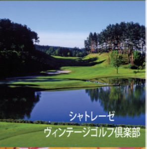
シャトレゼ ヴィンテージゴルフ倶楽部