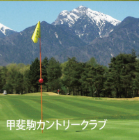
甲斐駒カントリークラブ