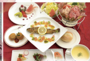
洋風御膳レギュラー