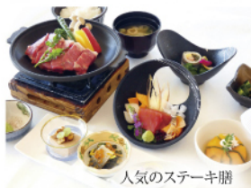
人気のステーキ膳